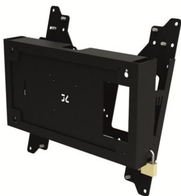
CONFIRE MWDI440 für Bildschirm und Computer