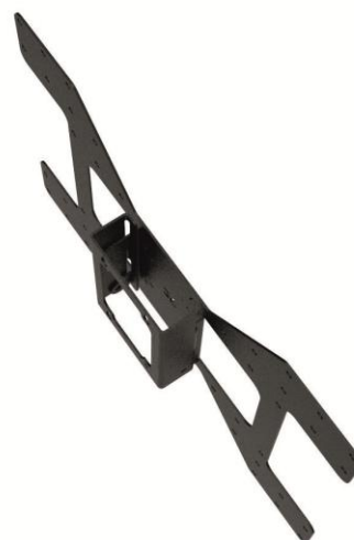
CONFIRE MWI440 für Bildschirme ohne Computerhalterung