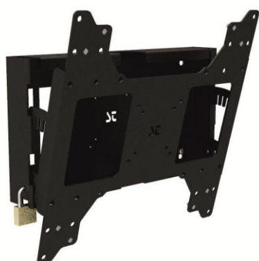
CONFIRE MWDI440 für Bildschirm und Computer