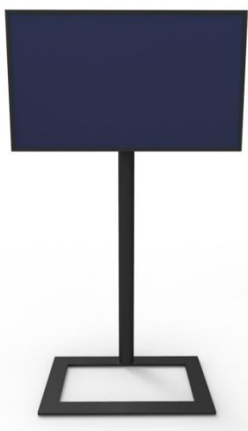
CONFIRE MS mit Fuß (ohne Rollen)