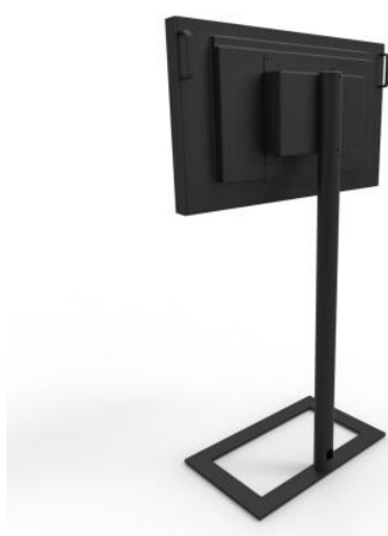
CONFIRE MS mit Fuß (ohne Rollen)