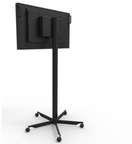
CONFIRE MS mit Rollfuß